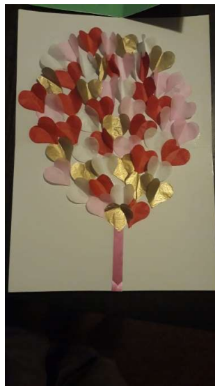
Knutselwerk van kinderen 2020

Met een aantal zorgaanbieders heeft de stichting een specifieke afspraak gemaakt voor de hulp aan onze cliënten. Mede met dank aan het 'Illegalenoverleg zorg' geïnitieerd door de GGD Zuidoost Brabant kunnen specifieke logistieke vraagstukken rondom de zorg voor deze groep mensen worden aangepakt.