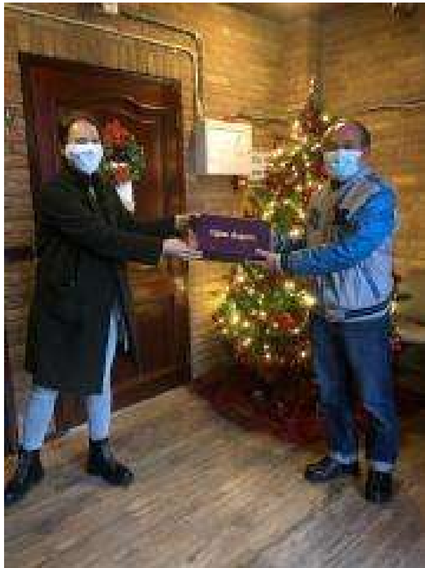
Kerstpakketten ontvangen van Rode Kruis 2020

Om het werk voor de cliënten goed te kunnen vervullen, neemt de stichting ook deel aan een aantal lokale, regionale en landelijke overleggen. Deze overleggen hebben een tweërlei functie voor de stichting. Enerzijds om samen te werken met anderen en ervaringen met anderen te delen, ter verbetering van het werk van de stichting. Anderzijds om onze expertise te delen met anderen, zodat zij ieder op eigen wijze zo goed mogelijk invulling kunnen geven aan ondersteuning van vluchtelingen.